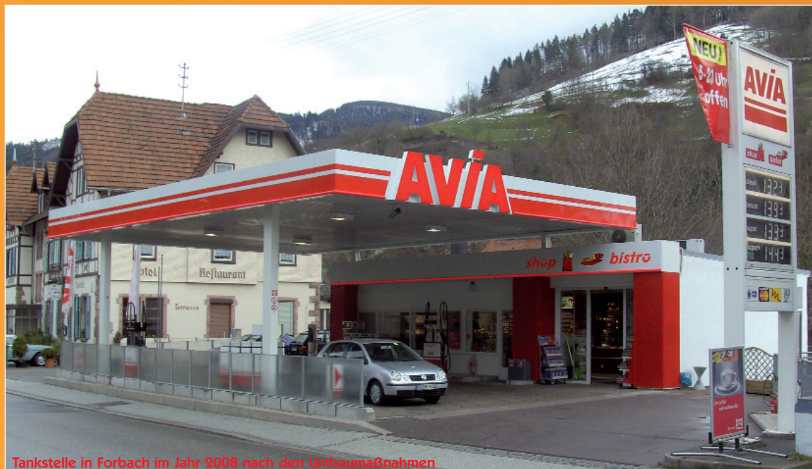
Tankstelle in Forbach im Jahr 2008 nach den Umbaumaßnahmen

wurde auch hier von AVIA hervorragend umgesetzt! Freundliche, gutgelaunte Mit-