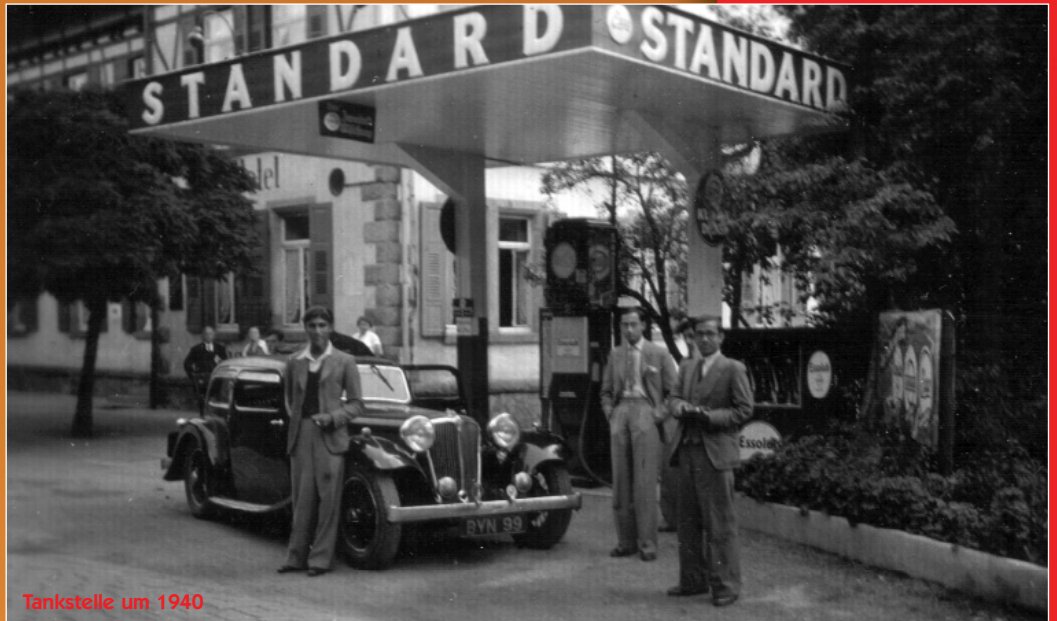
Tankstelle um 1940