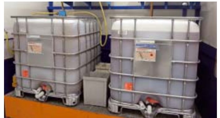
Je ein spezieller KSS der Oest Colometa-Reihe kommt beim Drehen von Stahlteilen sowie beim Fräsen von Teilen aus Aluminium zum Einsatz

Die Messerwalzen für Aktenvernichter und Schredder werden in unterschiedlichen Größen hergestellt. Zur Gewährleistung langer Lebensdauer bestehen sie aus hochlegiertem rostfreien Stahl. Die Schneiden werden auf speziellen Maschinen durch Tiefschleifen ins Volle mit hohen Abtragsraten erzeugt. Insbesondere dieser Prozess erfordert Schleiföle mit maximaler Leistungsfähigkeit, wie der Produktionsleiter betont: „Neben einer hohen Schleifscheibenstandzeit liegt unser Hauptaugenmerk auf der Verhinderung von Schleifbrand, vor allem an den empfindlichen Messerspitzen.“