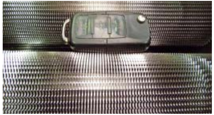
Die Walzen der HSM Schneidwerke verfügen über messerscharfe Zähne für hohe Präzision und Wirtschaftlichkeit