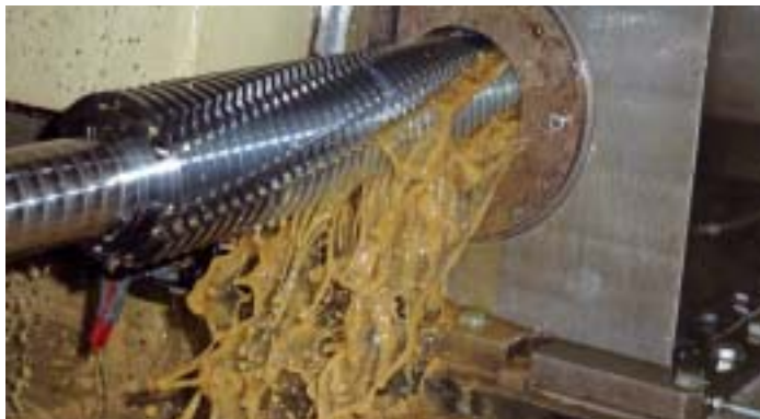
Beim Nutenschleifen werden synthetische und teilsynthetische Hochleistungsschleiföle der Produktfamilie Oest Meba G eingesetzt