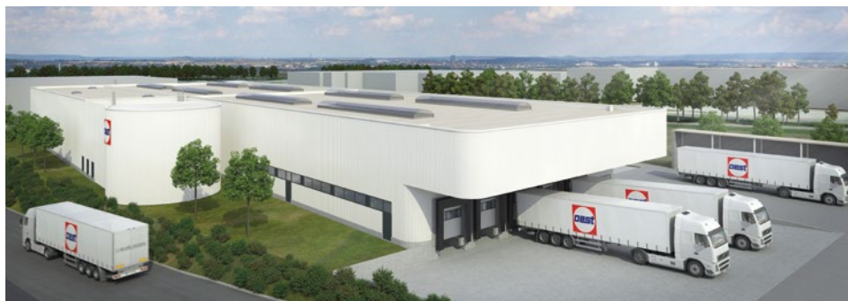
Mehrere Terminals sorgen für eine deutliche Entspannung im Bereich der LKW-Beladung.

Seite 4 • Perspektive Oest – Ausbildung und Duales Studium • Messetermine 2017 • Produkt-News – Aktuelles in Kürze