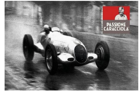
Rudolf Caracciola – 3 Europameistertitel, 144 Siege.

Gemeinsam mit weiteren Sponsoren wie Julius Bär, IWC und Mercedes-Benz unterstützen wir zukünftig als technischer Sponsor die Passione Caracciola. www.passione-caracciola.com