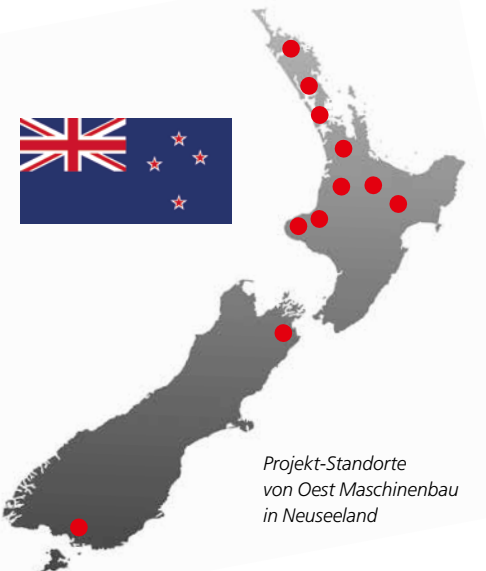
Projekt-Standorte von Oest Maschinenbau in Neuseeland

Klebstoff-Dosier- und Mischanlagen von Oest sind weltweit gefragt, so auch in Neuseeland. Die Zusammenarbeit mit Stroud hat sich aufgrund der großen Entfernung als strategisch wichtiger Schritt erwiesen. Kunden freuen sich über den schnellen, direkten Kontakt und die qualifizierte Betreuung vor Ort. Mehr als 10 Projekte konnten seither realisiert werden.