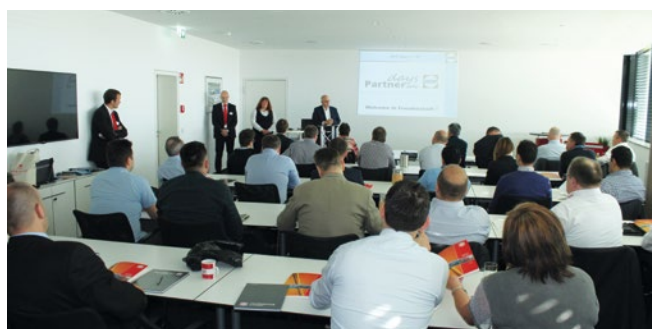
Links: Die verschiedenen Fachvorträge wurden mit großem Interesse verfolgt.

Alles in allem eine äußerst gelungene Veranstaltung, von der sich auch unsere Gäste begeistert zeigten – „I'm oestified!“